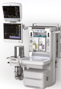
Система, монтируемая на стену (Carestation 650c)