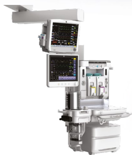
Подвесная система (Carestation 650c)